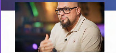
08 Den Wirkungsgrad kommunizieren

Wichtigste: den Wirkungsgrad kommunizieren