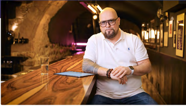
09 Aus der Lebenslinie das Lebensthema definieren